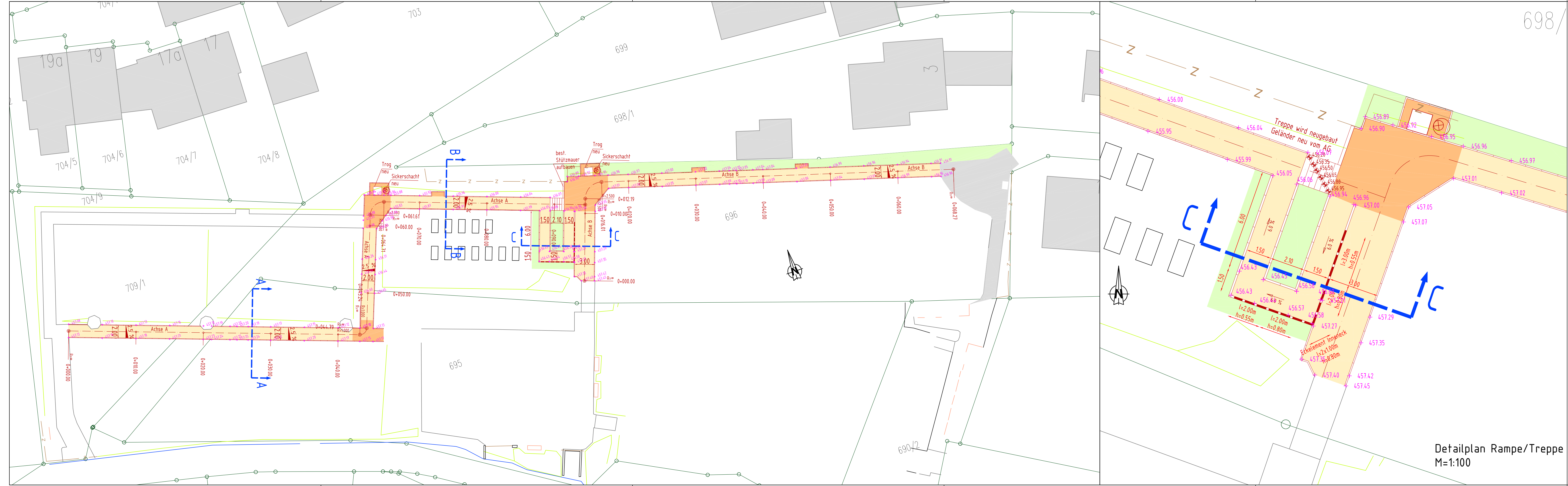
Detailplan Rampe/Treppe M=1:100