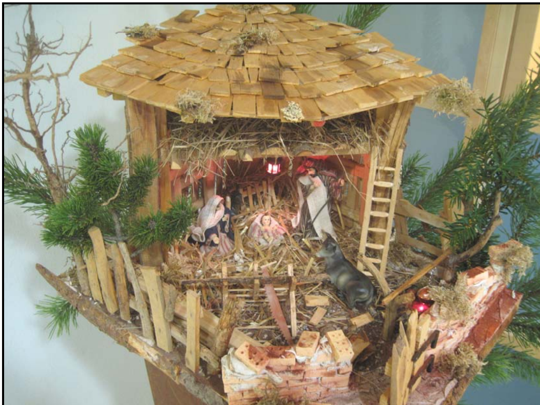
Krippe im Rathaus

Der Markt Au i. d. Hallertau wünscht allen Bürgerinnen und Bürgern ein gesegnetes Weihnachtsfest und ein glückliches neues Jahr 2013!