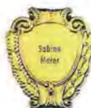
Nagel mittel ab € 100,00