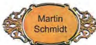
Spezialnagel ab € 250,00