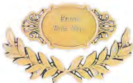
Spezialnagel mit Kranz ab € 500,00